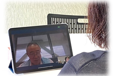
【一曰合同相談所の会場】

相談者から「オンラインで気軽に相談することができて助かった。説明も丁寧でとても良かった。」との御礼を言われた